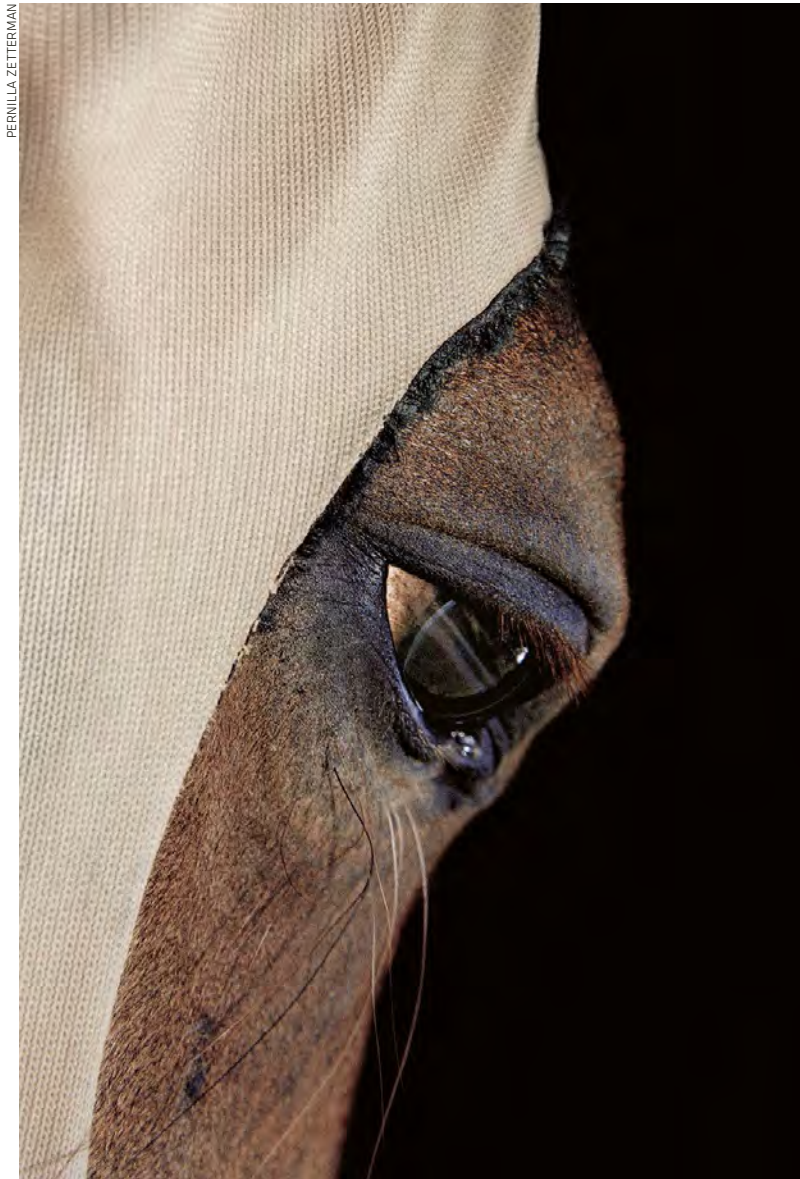
»Behind No 1«, fotografi, 120 x 78 cm, 2004.