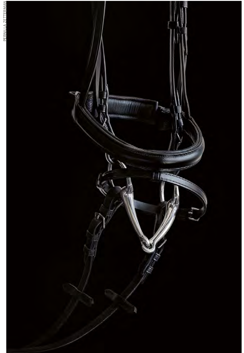
»Untitled No 12«, fotografi, 96 x 63 cm, 2010.