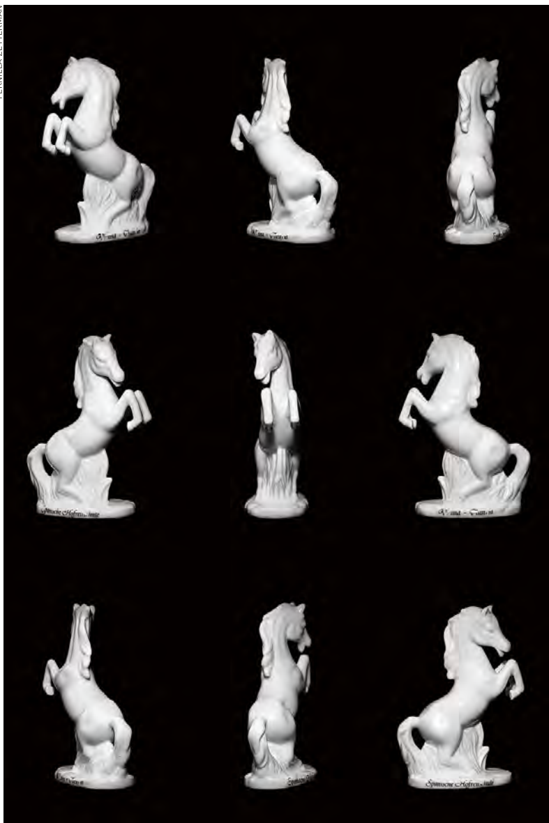
»Kanske hade jag burit drömmen för länge«, videoloop (original HD), 7 min, 2012.

cyklar? Kanske för att hästen ses som kvinnlig med sina stora ögon, långa man och kurviga kropp? Jag började aldrig med hästar, dels för att jag var rädd men också för att ridning, precis som andra tjejaktiviteter, nedvärderades och sexualiserades.